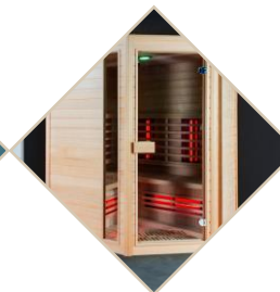
Sauna infrarouge 6 places