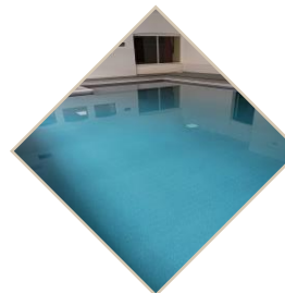
Piscine chauffée et couverte

L'entrée à notre espace relaxation vous donne accès aux installations suivantes.