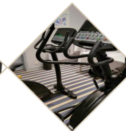
Salle de sport toute équipée

L'entrée est offerte pour tout achat d'un soin ou massage au Spa & pour les clients individuels de l' hôtel .